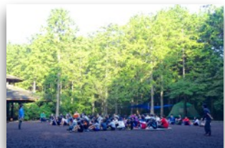
キャンプ場(Cサイト)