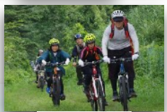
マウンテンバイク