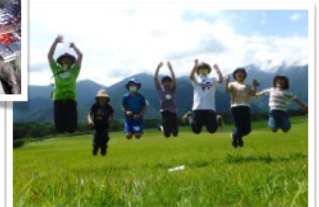
▲ キャンプ風景 (周辺散策)

かまどで火をつけて、みんなでごはんを作って、テントに泊まりながら、朝霧高原の川や山に遊びに出かける8泊9日のキャンプです。この夏は、朝霧高原・富士山の大自然の中で、たくさんの思い出をつくりませんか？