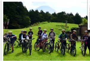
▲ お好み活動 (MTB、洞穴探検、川遊び、クラフトなど)