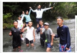
▲ 班別活動 (湧水巡り、善金山探検など)