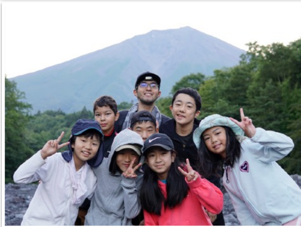
▲ 富士山原生林ハイキング 大沢崩れ